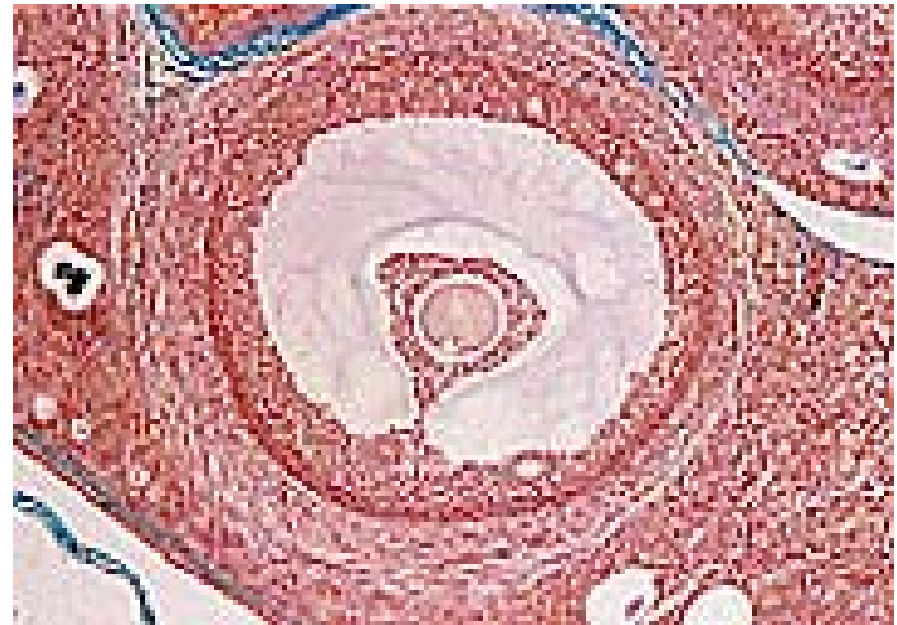
Microphotographie en microscopie optique d'un follicule mûr ou de De Graaf de Mammifère (diamètre du follicule : 4 mm environ)